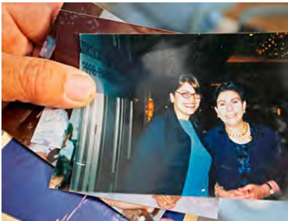
أحد أقارب رشيدة طليب في بيت عور الفوقا يعرض صورة تجمعها مع حنان عسراوي عضو اللجنة التنفيذية لمنظمة التحرير الفلسطينية.

بيت عور الفوقا - أفتاب: تأمل أسرة النائبة الأميركية الفلسطينية رشيدة طليب، وهي إحدى أولى مسلمتين تفوزان في انتخابات مجلس النواب الأميركي أن تتمكن من التأثير على بعض سياسات الرئيس دونالد ترامب المؤيدة لإسرائيل. وحققت طليب البالغ من العمر (٤٢ عاماً) إنجازاً تاريخياً، الثلاثاء، بفوزها عن مقعد في الدائرة الثالثة عشر في ميشيغان التي تضم أجزاء من ديترويت مع استعادة الديمقراطيين السيطرة على مجلس النواب.