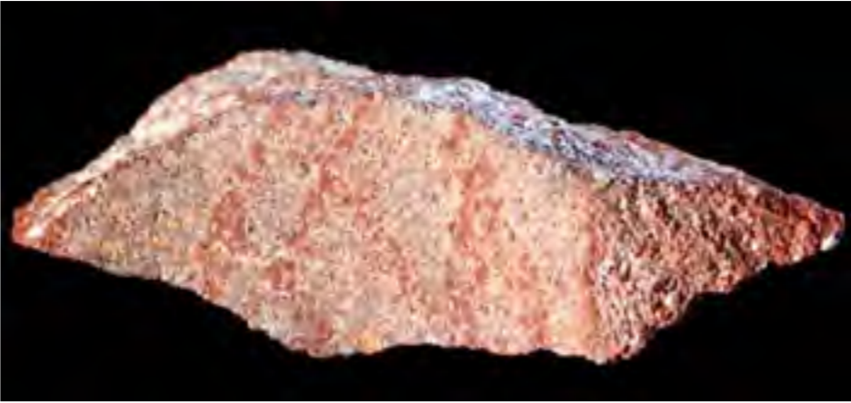
القطعة الصخرية السيليكونية مكتوباً عليها بقلم من حجر المغرة.

بأهمية خاصة، إذ إن الفريق عثر في الطبقات الأثرية عينها على أشكال مربعة مشابهة محفورة على قطع من المغرة باستخدام رؤوس صخرية". ويقول ديريكو: "هذه المرة الأولى التي نرى فيها النوع عينه من الرسوم منجزة على وسائط متنوعة مع تقنيات مختلفة". ويشير إلى أن "هذا الأمر يعزز فكرة أن هذه المربعات كانت موجودة حقًا في فكر هؤلاء البشر -الصيادين وقاطني الثمار- وأنها لم تكن "وليدة الصدفة". ويوضح أن هذه الإشارات كانت تحمل "دلالة رمزية"، مضيفًا: "لكن على الأرجح لم تكن تصنف على أنها من أشكال الفنون".